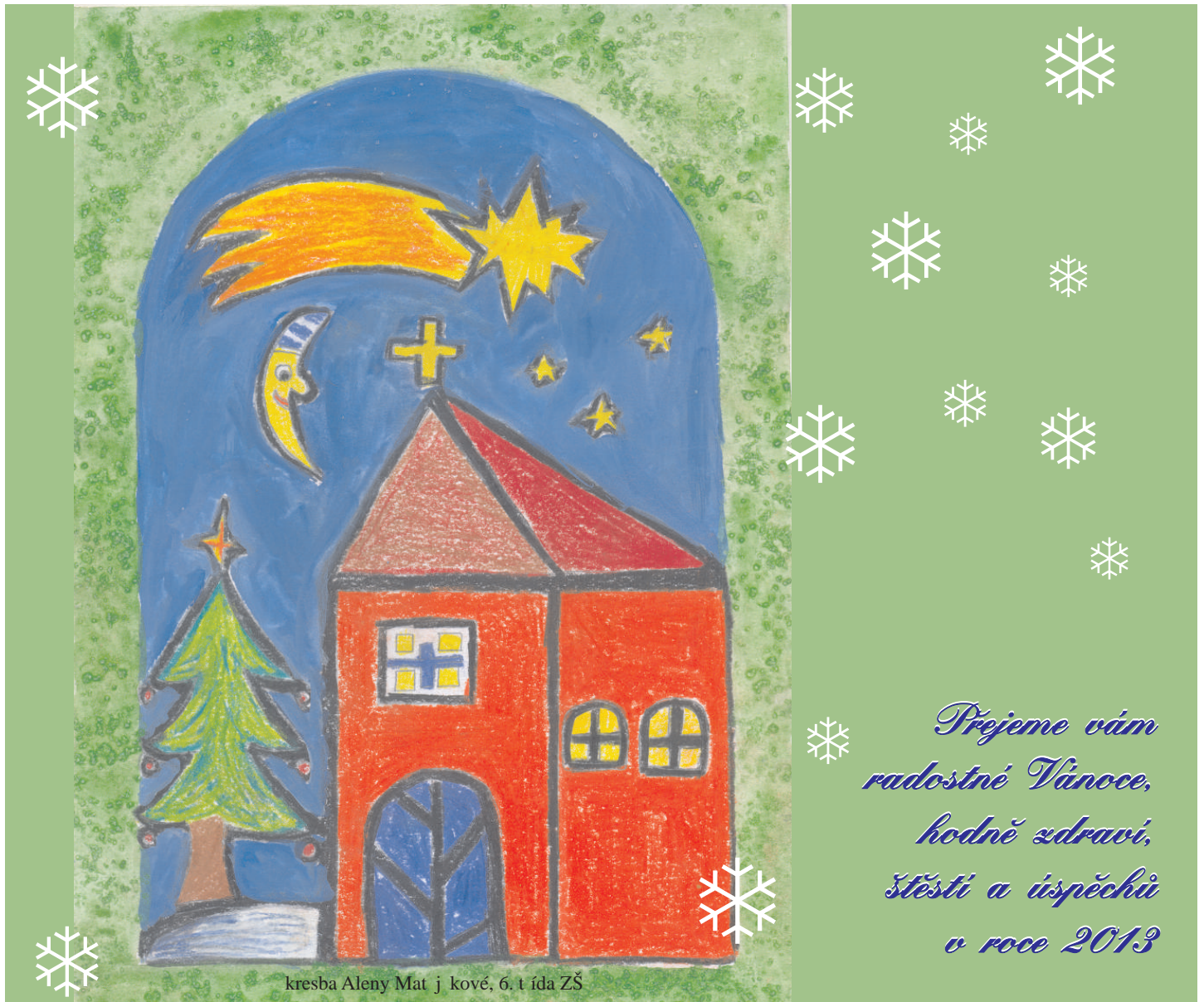
kresba Aleny Matějkové, 6. třída ZŠ

Prejeme vám radostné Vánoce, hodně zdraví, štěstí a úspěchů v roce 2013