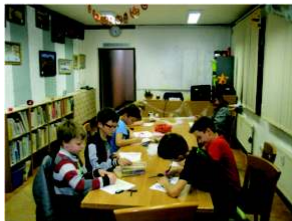
Děti z Domina