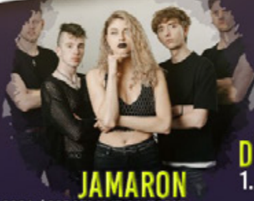
JAMARON 1. 6. 2024 / SOBOTA V 17:30 HODIN