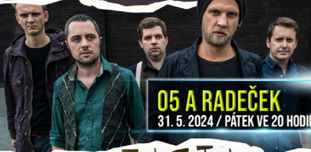
O5 A RADEČEK 31. 5. 2024 / PÁTEK VE 20 HODIN