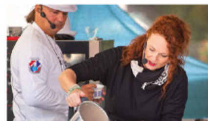
TRHY A VAŘENÍ NA PÓDIU

Nám. Svobody farmářské trhy pouze PÁTEK 20.9.