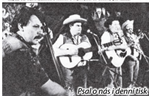
Psal o nás i denní tisk