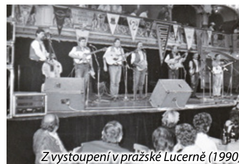
Z vystoupení v pražské Lucerně (1990)