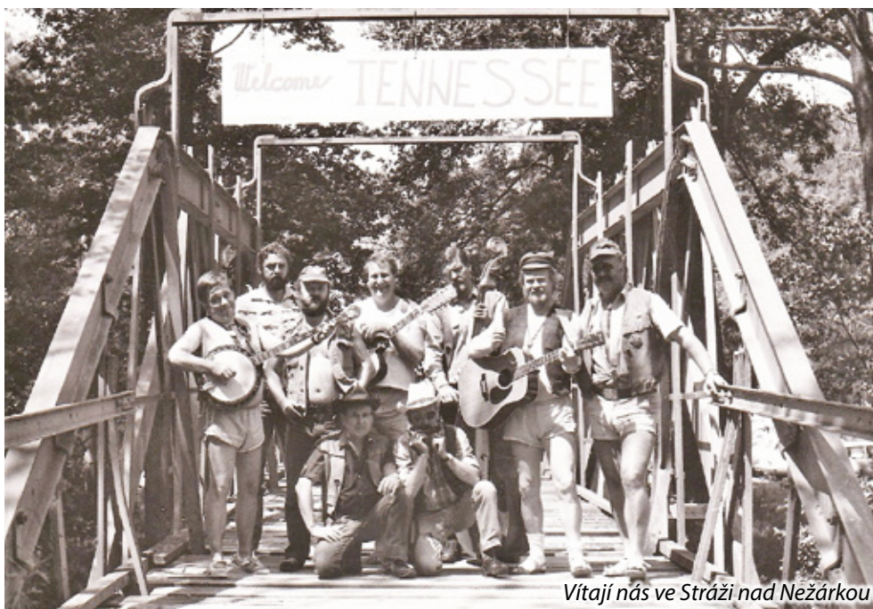
Vítají nás ve Stráži nad Nežárkou