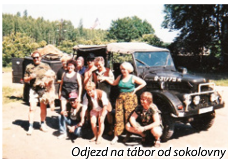
Odjezd na tábor od sokolovny