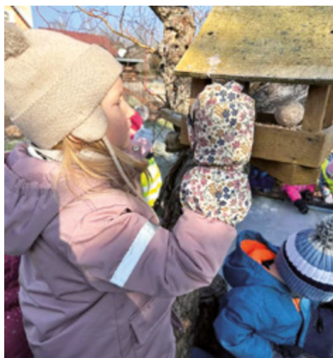
Staráme se o zvířátka.