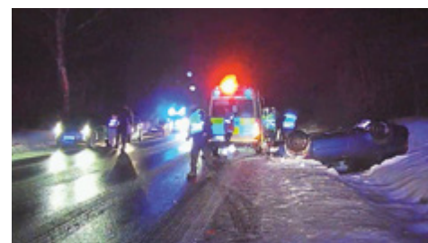
str. Nikola Daňková

Hlídky také asistovaly u dvou dopravních nehod na silnici I27 ve Střelné kousek od benzínové čerpací stanice. U první nehody skončil mladý řidič se svým vozidlem na střeše. Byla mu i jeho spolujezdkyni poskytnuta první pomoc a u druhé nehody byl ze strany strážníků usměrňován provoz