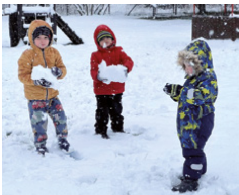
Užíváme si sněhovou nadílku