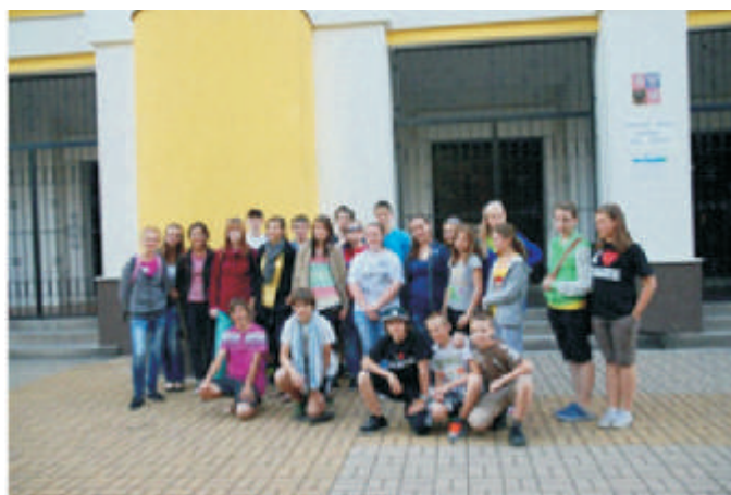
Odjezd - rozlou ení p ed školou