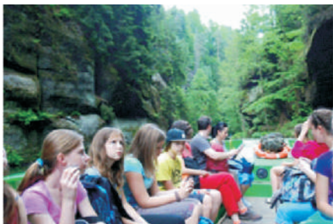
Navýlet ve H ensku