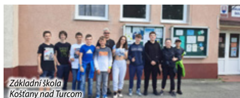
Základní škola Košťany nad Turcom

Po dlouhé době se opět uskutečnil Týden dětských radostí. V týdnu od 22. 5. do 26. 5. jsme se opět setkali s našimi slovenskými přáteli z Košťan nad Turcom a Valalik. S vybranými žáky jsme odcestovali do Košťan nad Turcom a konečně jsme se zase po covidové odluce všichni setkali a užili jsme si báječný týden plný zábavy, výletů, soutěží a hlavně dobré nálady. Poznali jsme nové kamarády, vyměnili jsme si kontakty a v samotném závěru uronili potoky slz. Někteří plakali ještě ve vlaku cestou domů.