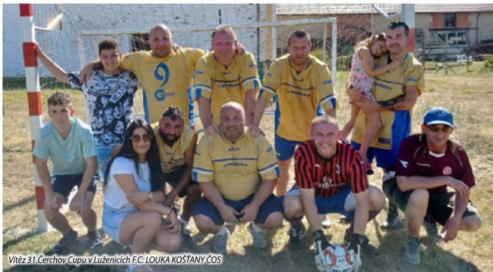
Vítěz 31. Čerchov Cupu v Luženicích F.C. LOUKA KOŠTANY ČOS