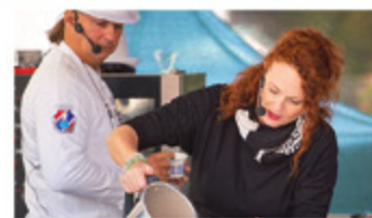
TRHY A VAŘENÍ NA PÓDIU