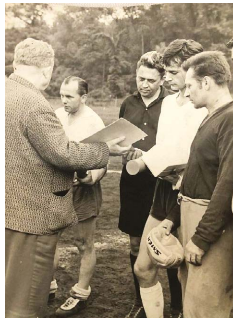
1968 - vítězství v Poháru Směru

Oslavenci vše nejlepší přejí TJ Sokol Košťany, kamarádi a známí.