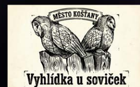
Vyhlička u soviček