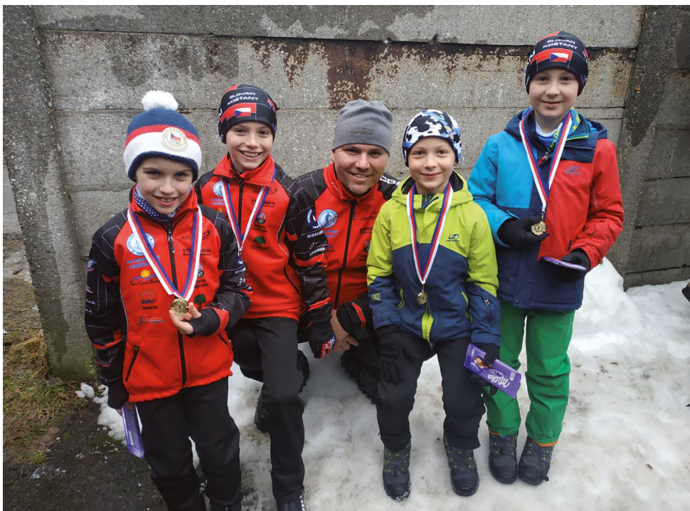
... nejrychlejší štafety kluků v nejmladších a mladších žácích v Ústeckém kraji jsou z Košťan.