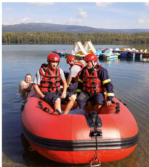
Výcvik se člunem