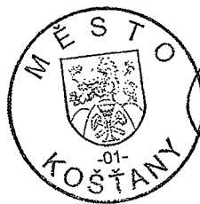
Tomáš Sváda Tomáš Sváda starosta města