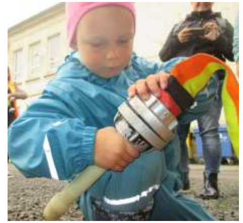
Tond v Soptík-2C Osek 16.9.2017