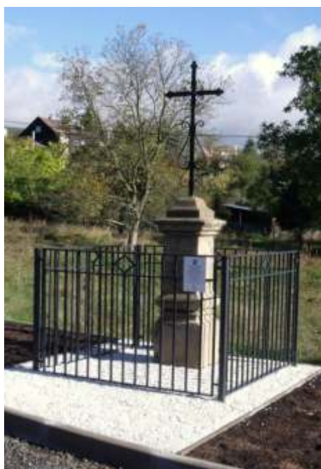
Pamětní kříž ve Střelné, Hampuši