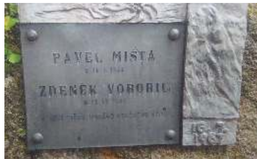
snímek pamětní desky umístěné na „cintorín“ Popradské pleso.