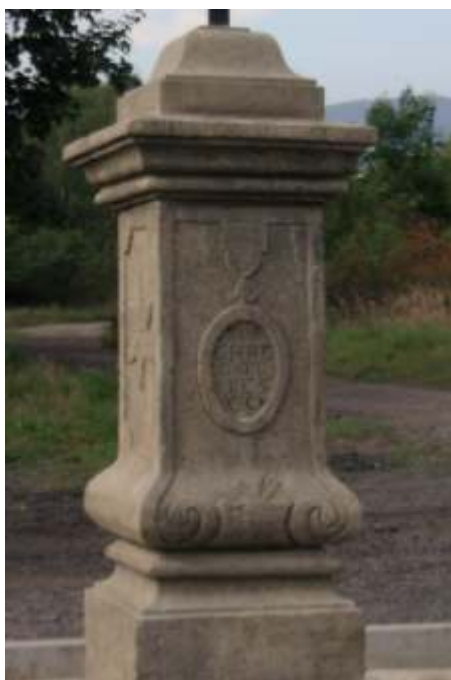
Zrestaurovaný sokl před dokončením v sochařském ateliéru