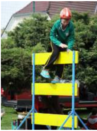
Okresní kolo hry Plamen - p ekonávání p ekážky