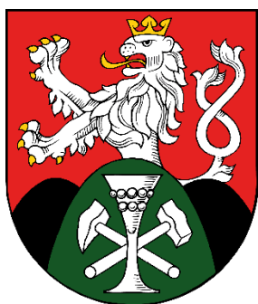
Znak města Košťany

Město Košťany , ležící ve výšce 270 m n.m., se rozkládá zčásti na severním okraji teplické roviny a zčásti na úpatí Krušných hor, necelých 5 km severozápadně od lázeňského města Teplice. Podle sčítání lidu v roce 1991 zde bylo 474 domů a ve městě žilo 2 498 obyvatel. Katastrální území města je tvořen katastrem Košťan a Střelné a má rozlohu 2431 ha a v současné době má 3219 obyvatel .